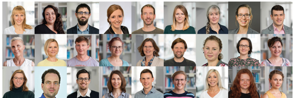
Ein starkes Team – Mitarbeiterinnen und Mitarbeiter des Instituts