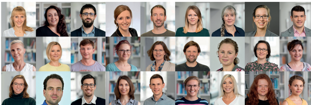
Ein starkes Team – Mitarbeiterinnen und Mitarbeiter des Instituts

Teilen Sie uns gern Ihre Ideen oder Vorschläge für die kommenden Ausgaben mit. Kontakt: Robby.Markwart@med.uni-jena.de