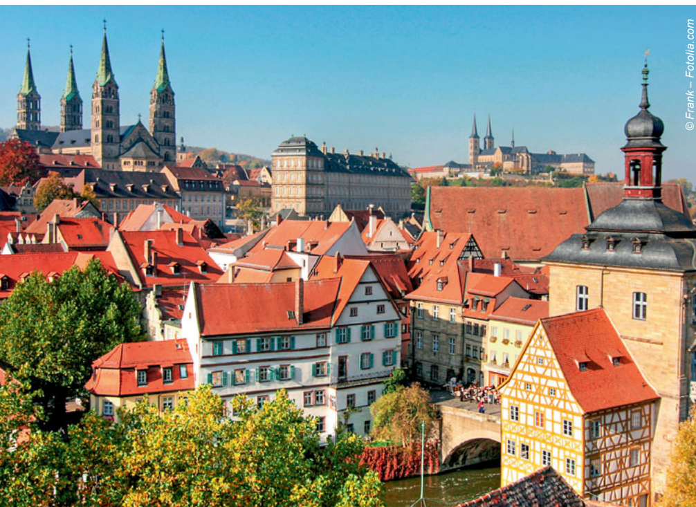
Die Bamberger Altstadt wurde 1993 in die UNESCO-Liste des Weltberbes der Menschheit aufgenommen.