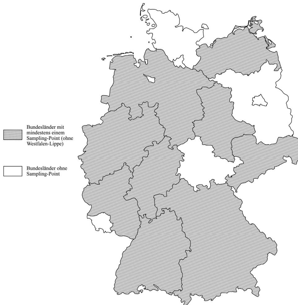
Abbildung 1. Regionale Verteilung der Sampling-Points.

und gelungenen Patientenversorgungen ausgewertet. Aus diesen Erzählungen über die Versorgungsabläufe konnten die von den Versorgungsakteur*innen wahrgenommenen Kriterien für eine gelungene oder problematische Versorgung herausgearbeitet werden. Alle Interviews wurden mit einem digitalen Aufnahmegerät aufgezeichnet und im Anschluss durch ein Transkriptionsbüro mit an Kuckartz [17] angelehnten Transkriptionsregeln verschriftlicht.