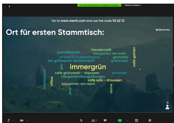
Kick-Off-Meeting via Zoom und Menti-Umfrage

Im Mai sollte eigentlich das jährliche Retreat für alle Kollegiatinnen und Kollegiaten der IZKF-Nachwuchsförderprogramme im Waldhotel in Luisenthal stattfinden. Ein buntes Programm inklusive eines Mentoring-Workshops war geplant, wissenschaftliche Vorträge unterschiedlicher Fachrichtungen organisiert und auch für das soziale Miteinander war gesorgt. Leider kam Corona dazwischen. Von jetzt auf gleich mussten nicht nur die Kollegiatinnen und Kollegiaten ihre Arbeit im Labor und mit den Probanden umstellen, sondern auch die Fördermaßnahmen in den Programmen mussten angepasst werden. Das bedeutete in erste Linie die Umstellung auf neue Kommunikationsformen und die Nutzung von Online-Videokonferenztools. Das monatliche CS/MS-Seminar konnte bereits nach einigen Wochen im neuen Format etabliert werden und wurde gut in den Programmen angenommen. Auch die geplanten Qualifizierungskurse wurden umgestellt und liefen über Zoom und Moodle an. Als besondere Veranstaltung fand das Kick-Off-Meeting für die neuen Kollegiatinnen und Kollegiaten der 2. Förderrunde der IZKF-Nachwuchsförderprogramme per Zoom statt. Mit kurzem Steckbrief stellte sich jeder Kollegiat/jede Kollegiatin vor und gab einen ersten Einblick in sein/ihr Forschungsprojekt. Außerdem kamen Menti -Umfragen und das Jamboard zum Einsatz.