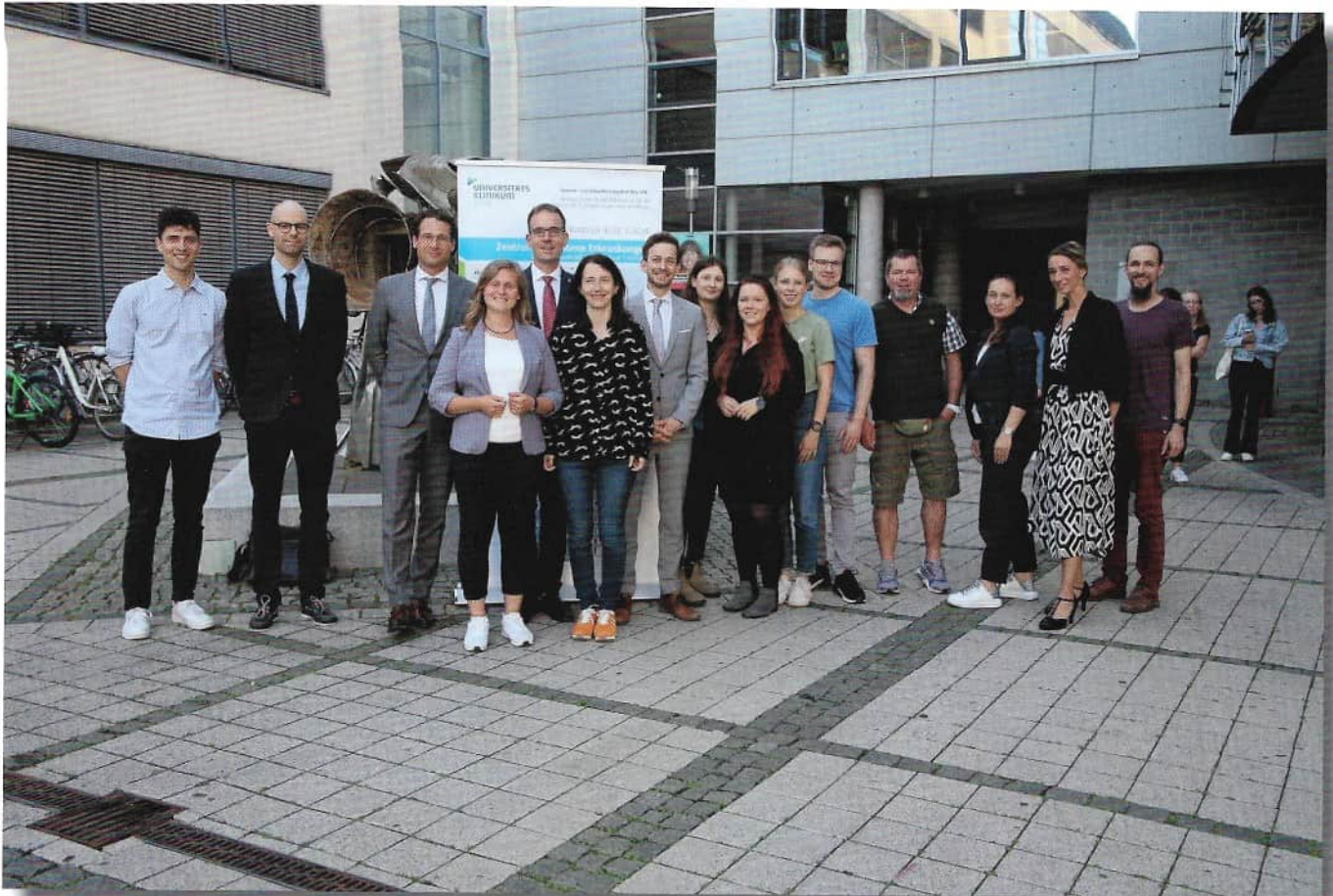
Alle ReferentInnen und Mitwirkenden

Das Fazialis-Nerv-Zentrum am Universitätsklinikum Jena lud am 06.06.2024 zum 4. Fazialis-Nerv-Tag unter dem Thema „Synkenisien“ ein. Auch in diesem Jahr konnte die Veranstaltung entweder vor Ort im MultiMedia Hörsaal der Friedrich-Schiller-Universität Jena oder via Live-Übertragung per Zoom verfolgt werden.