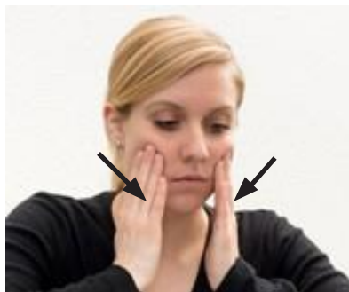
mit beiden Händen