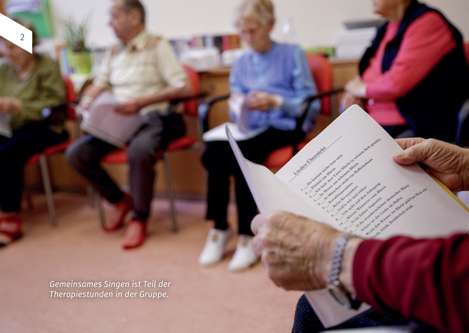
Gemeinsames Singen ist Teil der Therapiestunden in der Gruppe.