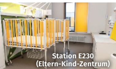
Station E230 (Eldern-Kind-Zentrum)