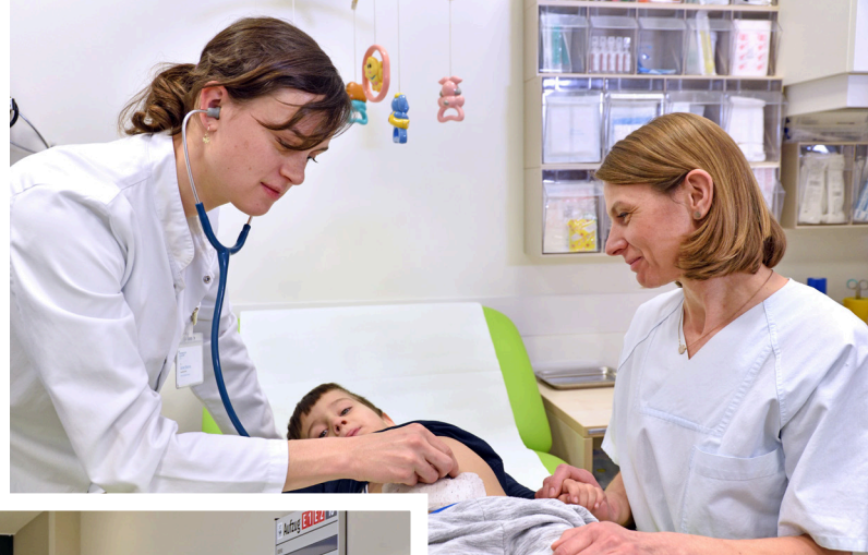
◀ B230 kinderchirurgische Station