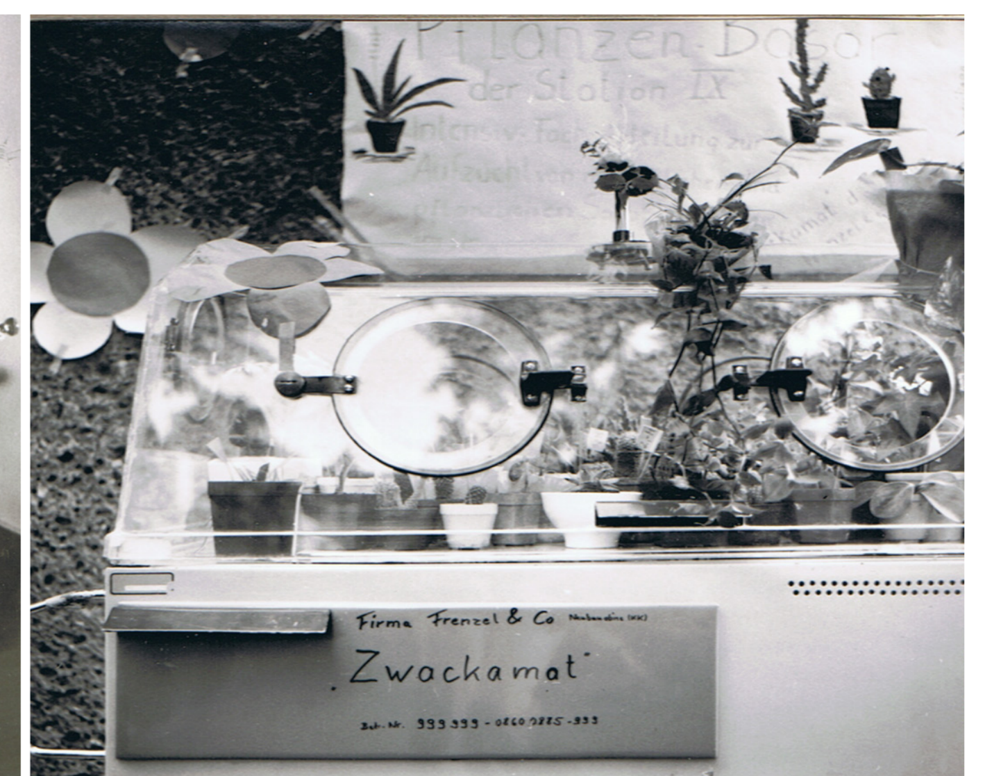
Der Fortschritt hält Einzug - links die neue Milchküche , Mitte die EEG-Abteilung , darunter die neue Röntgenabteilung (ca 1952), rechts die eiserne Lunge (ca 1954) und der erste Inkubator „Zwackamat“ (hier zweckentfremdet) - ca 1985