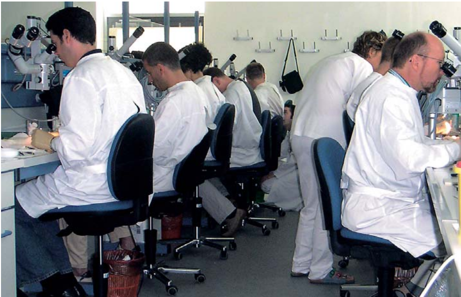
Die Kursteilnehmer üben am Modell mikrochirurgische Nahttechniken zur Gefäßanastomosierung unter Anleitung durch die Kursbetreuer

tungen gibt. „Allerdings nicht in dieser Komplexität und ohne Live-Operationen.“