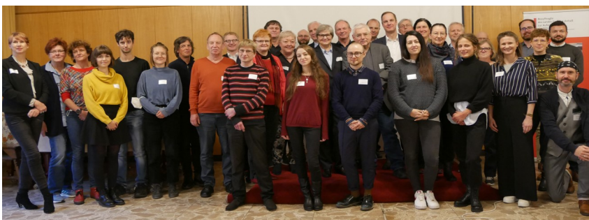
Die Projektmitarbeitenden inkl. Projektleiter, Projektbeirat und Gäste.