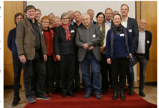
Der Beirat und die Projektleiter während des Kick-off-Meetings am 03.11.21.