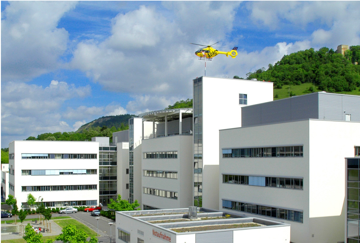
Ansicht Universitätsklinikum Jena, Standort Lobeda