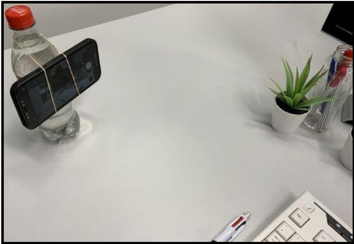
Abbildung 1: Niedrigschwellige Aufnahmeeinrichtung zur Videoaufsicht.