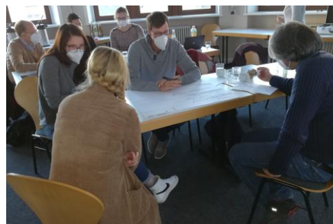
Teilnehmende beim Prüfungsworkshop 2022

Anmeldung Mailverteiler: medizindidaktik@med.uni-jena.de