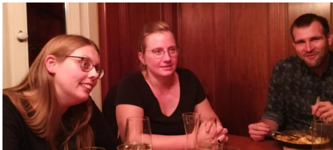
Stammtisch November 2022