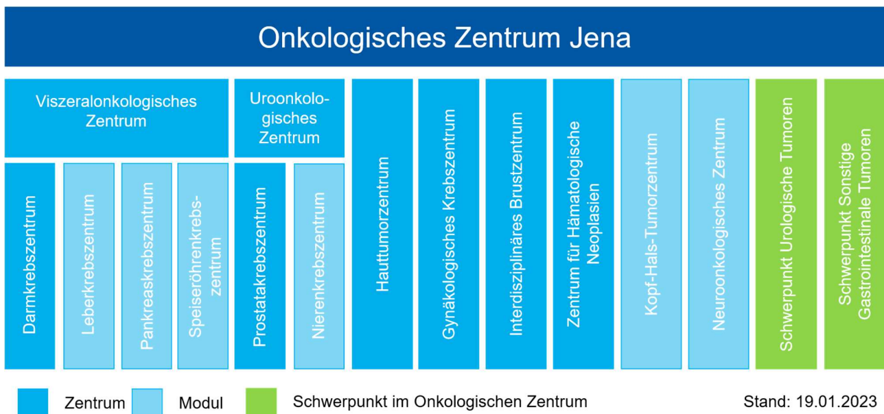
Abbildung 1: Struktur des Onkologischen Zentrums Jena – Übersicht über die derzeit (Stand: Januar 2023) nach den Kriterien der DKG zertifizierten Entitäten.

Das UTC verfügt derzeit über 26 Mitarbeiter sowie einen Vorstand aus sechs Mitgliedern. Hauptaufgabe des UTC ist die Betreuung der nach den Kriterien der Deutschen Krebsgesellschaft (DKG) zertifizierten Organkrebszentren. Im UTC vereinigen sich aktuell 20 Kliniken und 10 Institute, in welchen die betreuten Tumorentitäten getreu unserem Leitgedanken „Behandeln – Forschen – Informieren“ einer interdisziplinären Betrachtungsweise unterzogen werden. Unter dem Dach des UTC sind momentan sechs Zentren, sechs Module und zwei Schwerpunkte nach den Kriterien der DKG zertifiziert. Der Aufbau des Onkologischen Zentrums Jena inkl. der derzeit nach DKG zertifizierten Zentren kann der nachfolgenden Abbildung 1 entnommen werden.